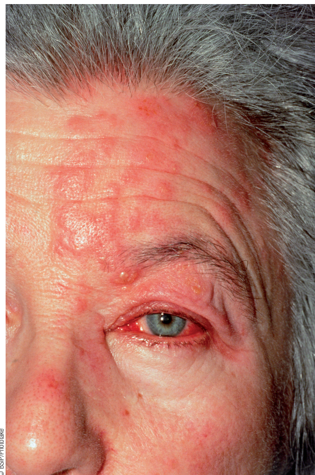
Le zona ophtalmique représente 10 à 25 % des cas de zona et nécessite un examen ophtalmologique approfondi.

◆ La fréquence de l'infection augmente avec l'âge , en lien avec