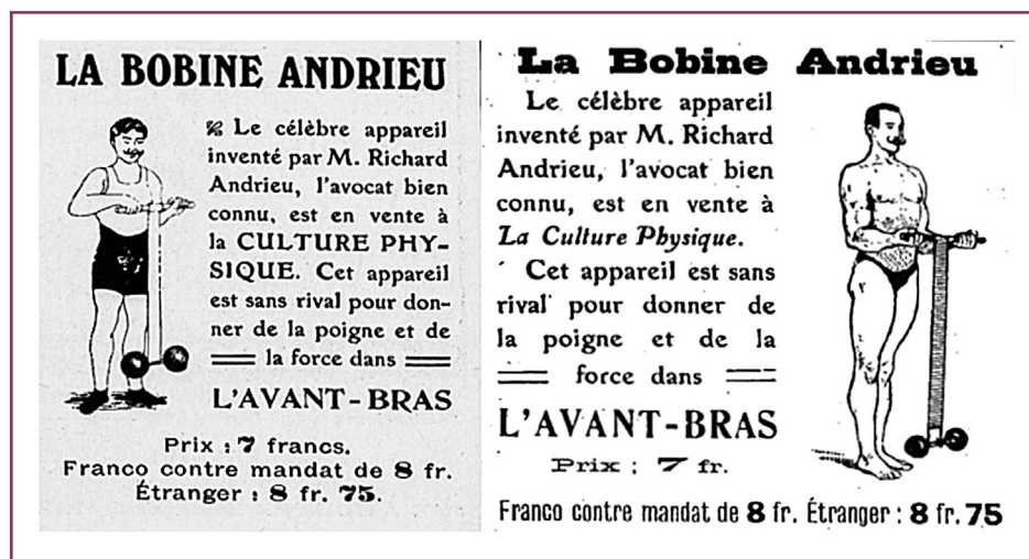
Figure 2. Les 2 publicités retrouvées au fil des numéros de la revue La Culture Physique .