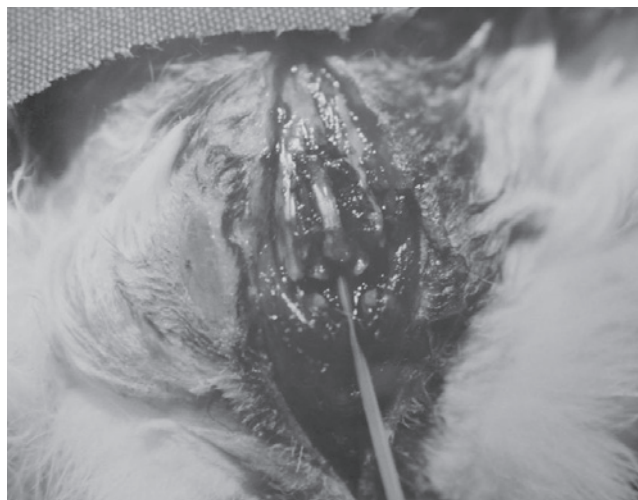
Figura 1 Avance del catéter a través del hiato sacral.

por vía subcutánea entre el nivel determinado y el cuello y el catéter fue enseguida insertado en el túnel subcutáneo en dirección al cuello (fig. 2). La piel se suturó en las regiones que recibieron incisión (fig. 2). Los catéteres se mantuvieron en los conejos durante 10 días para verificar la eficiencia. Suero fisiológico (1 mL) fue usado todos los días para evitar la obstrucción del catéter. El último día, la posición de los catéteres fue verificada con el uso de 1 mL de lidocaína al 1%. Después, una dosis alta de tiopental fue administrada por vía intraperitoneal y todos los animales fueron sacrificados. Finalmente, la laminectomía fue realizada para confirmar el posicionamiento de los catéteres en el espacio epidural.