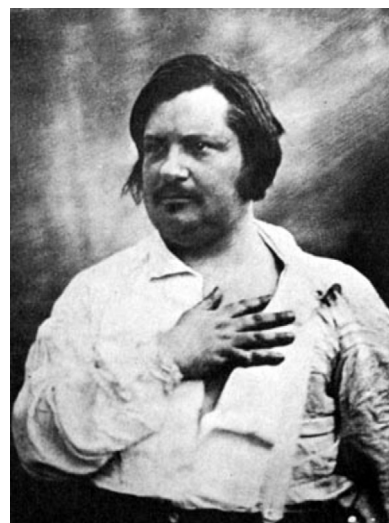
Figura 1 Honoré de Balzac.

En El cura de Tours , por ejemplo, describe con sarcasmo la forma de andar de las solteras: «Andaba sin que el movimiento se distribuyese igualmente por toda su persona para producir esas graciosas ondulaciones tan atractivas en las mujeres: andaba como si fuese, por decirlo así, de una sola pieza, y a cada paso parecía surgir como la estatua del Comendador» 12 . En esta descripción hace referencia a factores físicos, como la estatura o la rigidez de movimientos, y a factores sociales, como la soltería, que hace que el personaje se mueva, según Balzac, de forma envarada.