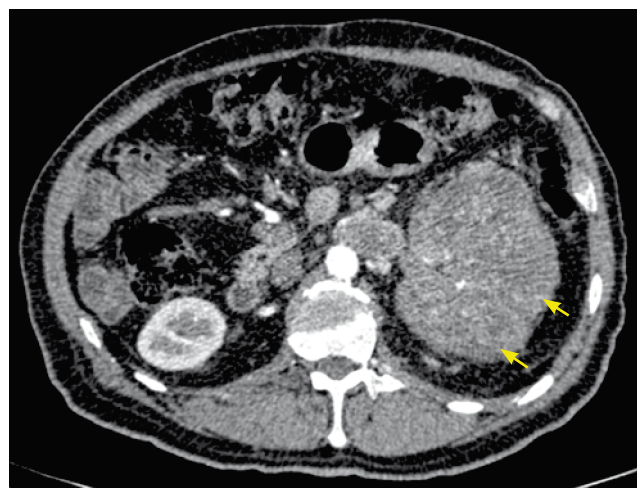
Figura 1 Tomografía axial computarizada, corte axial. Se identifica claramente tumor renal izquierdo (flechas).

Se somete a nefrectomía radical y durante el transoperatorio se confirma vena cava inferior en situación izquierda, con trombo tumoral en su interior, tal como se había observado en la tomografía; también se nota la presencia del segmento proximal de la vena cava inferior dentro del tumor (fig. 3). Se realiza nefrectomía con control vascular (fig. 4) y trombectomía proximal de vena cava, obteniendo trombo tumoral con maniobra de Valsalva y cerrando muñón de vena cava inferior con doble línea de Prolene® 6-0, doble armado.