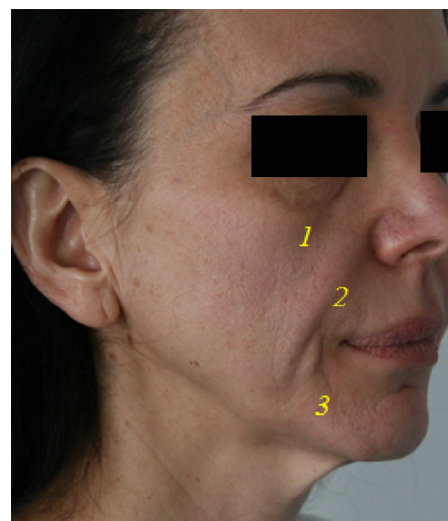
Figure 2 Sillons. 1 : médio-jugal ; 2 : naso-génien ; 3 : labio-mentonnier.