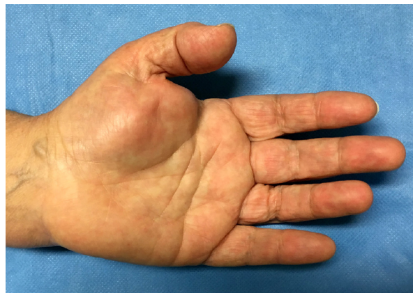
Figura 2 – Tumefacção da eminência tenar.

Objetivamente a doente apresentava uma massa palpável no nível da eminência tenar, móvel, de consistência mole e indolor (fig. 2). A percussão da massa desencadeava queixas de parestesias dos primeiros três dedos da mão esquerda (sinal de Tinel positivo). A doente não apresentava queixas motoras da mão, com preservação da força e da função de pinça digital. Não se palpavam adenopatias axilares.