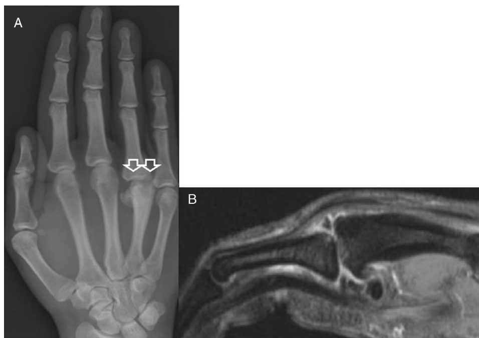
Figura 1 – A) Radiografía dorso-palmar de la mano derecha mostrando colapso subcondral de la cabeza del metacarpiano y subluxación de la articulación MTCF. B) Resonancia magnética con área de osteonecrosis en la cabeza del cuarto metacarpiano.

Durante el control clínico realizado a los 8 años del comienzo de los síntomas, el paciente presentaba una puntuación de 10 en el cuestionario Disabilities of the Arm, Shoulder and Hand (DASH). La radiografía simple reveló una remodelación de la articulación MTC y signos de consolidación ósea de la fractura metacarpiana presentando una movilidad activa completa y no dolorosa de los dedos (fig. 2).